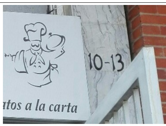
Fotografía N° 2. Nomenclatura del Predio.