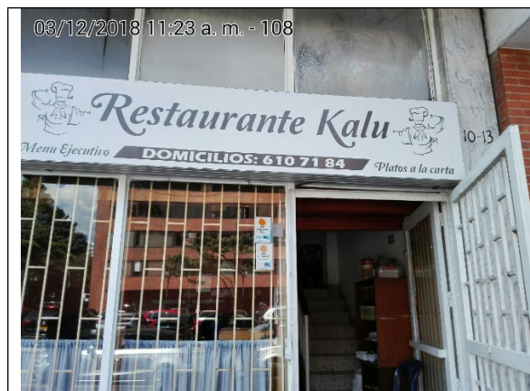
Fotografía N° 1. Fachada del Predio.